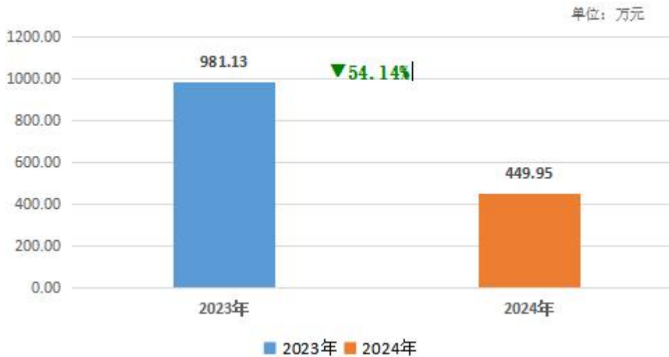
一般公共预算财政拨款支出决算情况

7. 住房保障支出(类)住房改革支出(款)住房公积金(项)。年初预算为 26.67 万元，支出为 26.67 万元，完成预算的 100%。