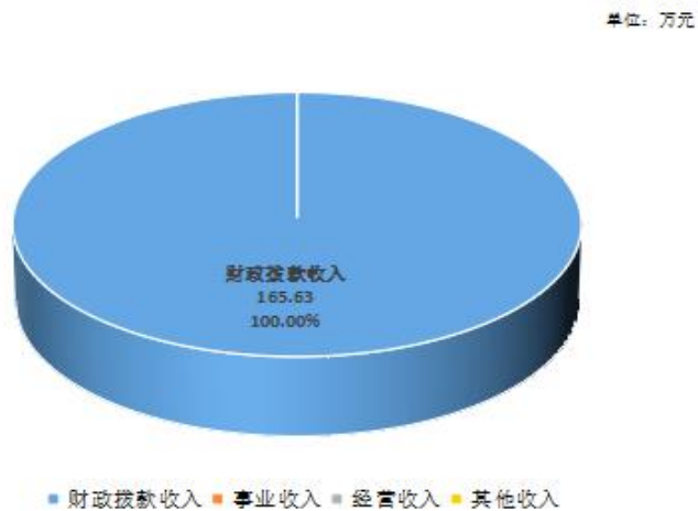
2024年度本年收入构成

2024 年度本年收入合计 165.63 万元，其中：财政拨款收入 165.63 万元，占 100%；事业收入 0.00 万元，占 0%；经营收入 0.00 万元，占 0%；其他收入 0.00 万元，占 0%。